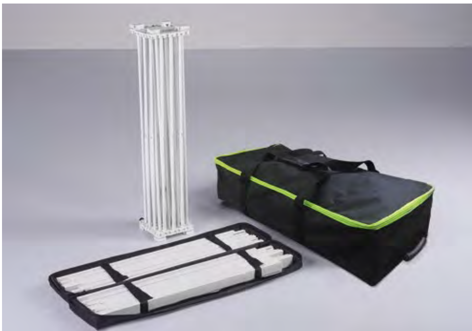
Structure complète livrée dans un seul sac