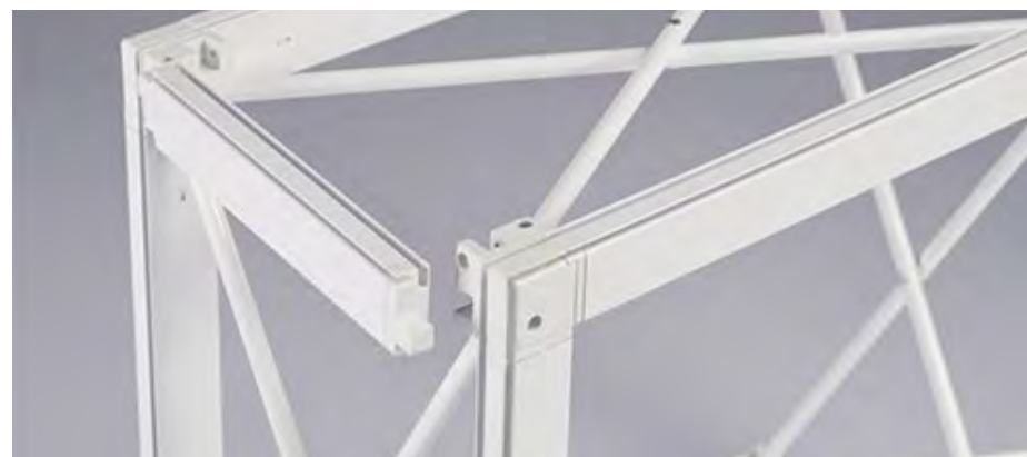
Barres rainurées qui se clipsent sur la structure